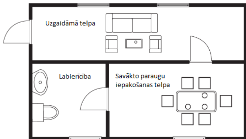
Dopinga kontroles stacija

Piemērotas DKS vizualizācija. Uzgaidāmās telpas lielums ir atkarīgs no paredzēto dopinga kontroļu skaita. Tāpat paraugu iepakojšanas telpu skaitam jābūt atbilstošam veicamo dopinga kontroļu skaitam.